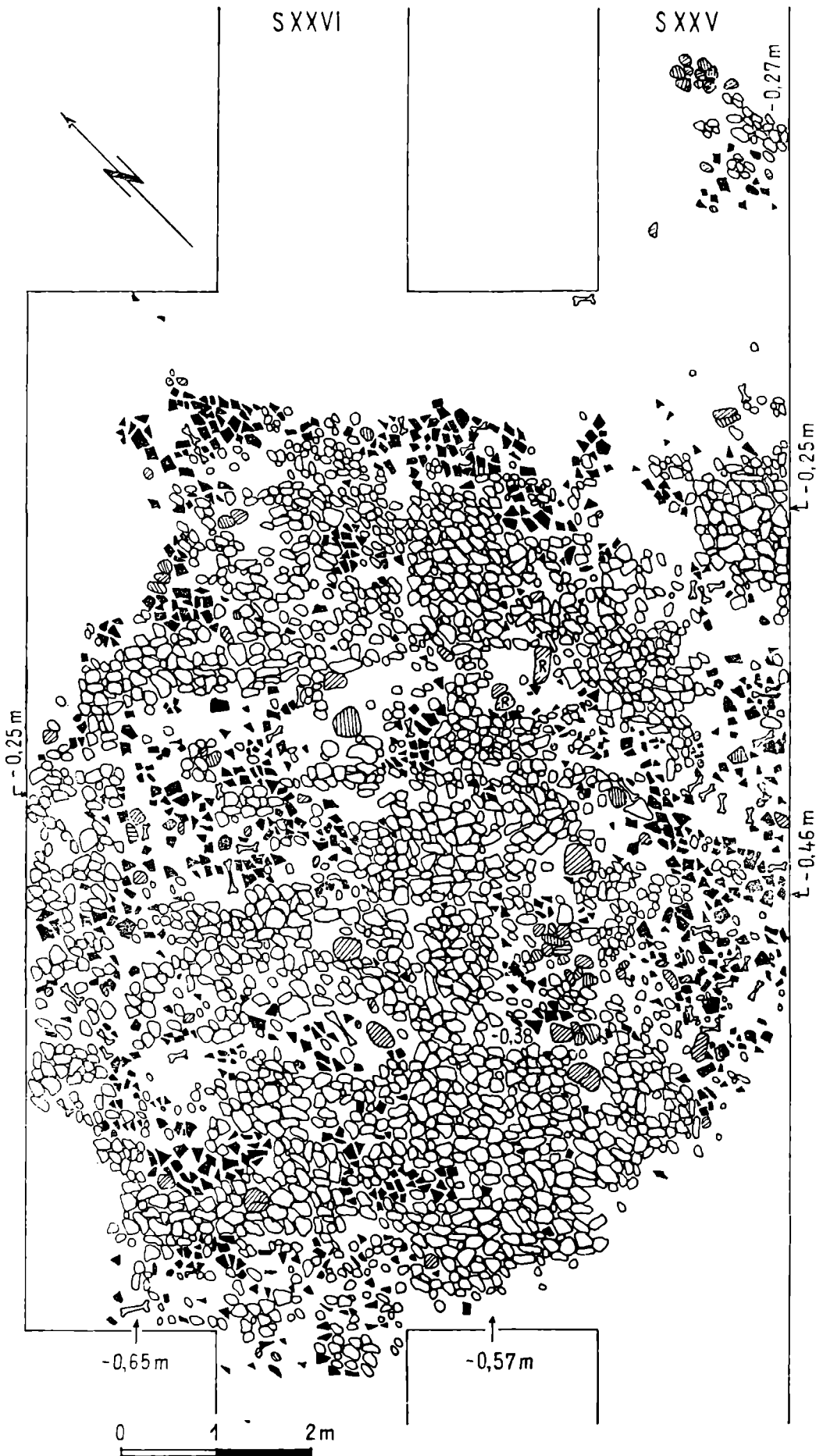
Fig. 2. Drăgușeni-Ostrov. Resturile locuinței nr. 15.